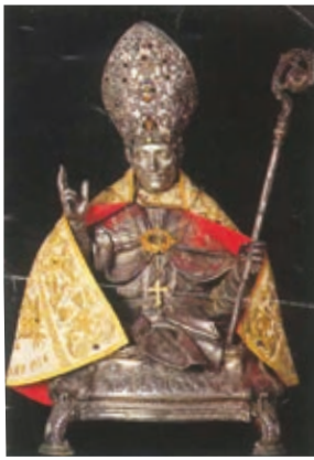
SAN GIOVANNI (14 Aprile 1094) Cittadino, Vescovo e Protettore di Montemarano (Avellino)

San Giovanni nostro Glorioso Protettore intercedi per noi